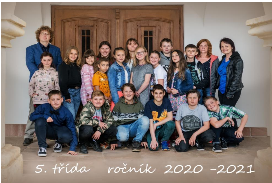
5. třída ročník 2020 -2021