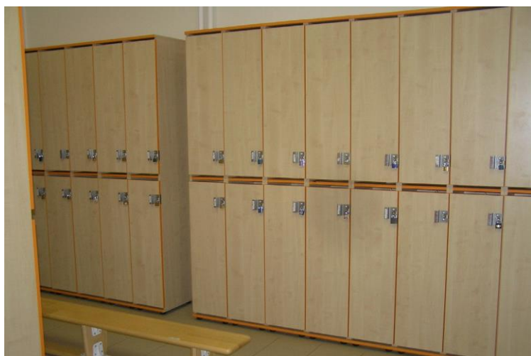
Šatna na II. st. ZŠ