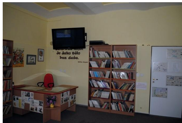
Knihovna, relaxační místnost