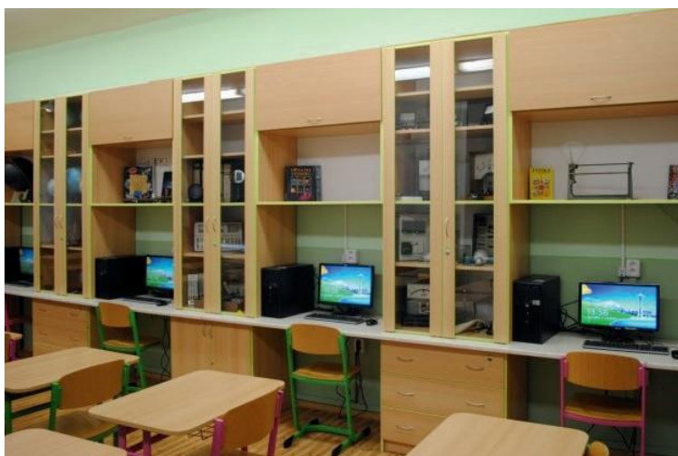
Multimediální učebna s PC