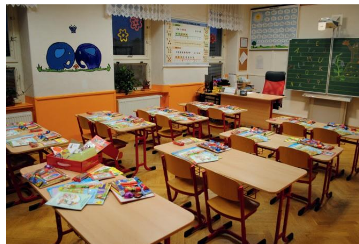
Učebna na I. stupni ZŠ před rekonstrukcí podlah