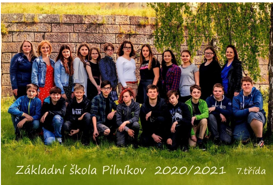
Základní škola Pilníkov 2020/2021 7.třída