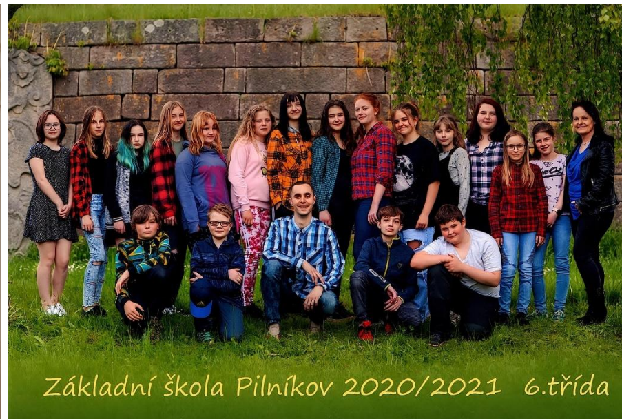
Základní škola Pilníkov 2020/2021 6.třída