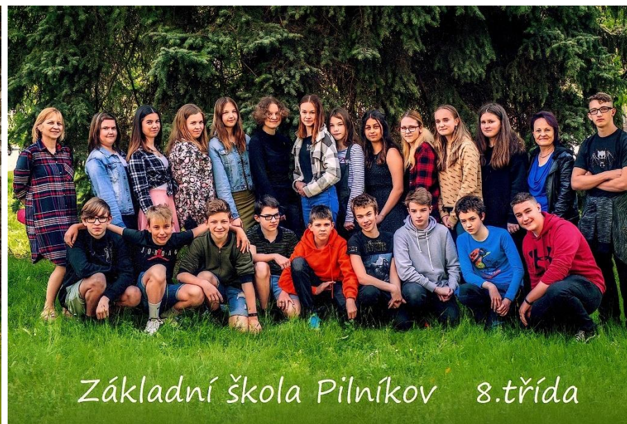
Základní škola Pilníkov 8.třída